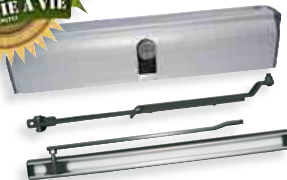
Bras universel (Tirant/Poussant)